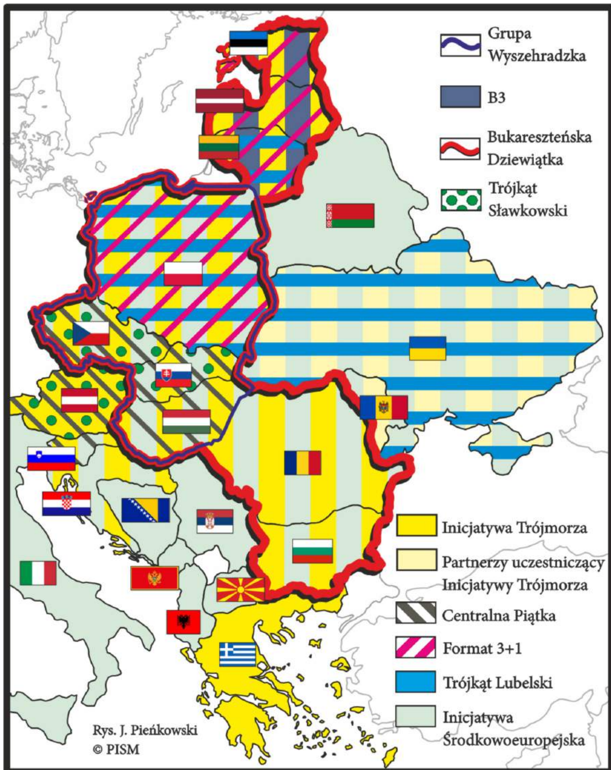
RYŚ. 1. FORMATY POLITYCZNEJ WSPÓŁPRACY REGIONALNEJ W EUROPIE ŚRODKOWEJ