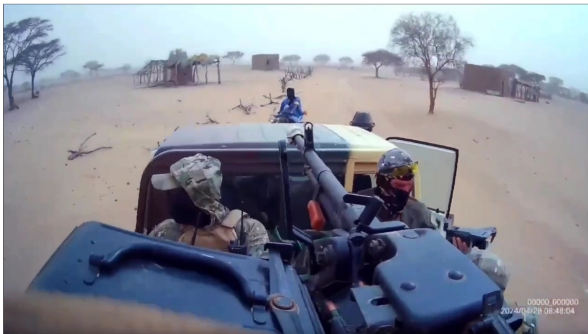
KA patrolujący okolicę granicy Mali i Mauretanii w kwietniu 2024 r.