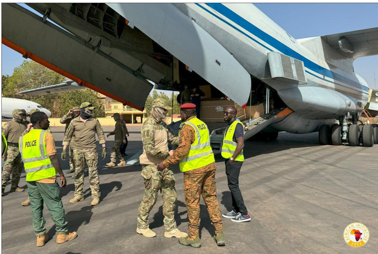
Przybycie kontyngentu KA do Burkina Faso w styczniu 2024 r.

Telegramie African Initiative, który jako pierwszy (przed oficjalnym kanałem KA) opublikował zdjęcia z rozładunku, misja służyć ma w pierwszym rządzie ochronie drogi Wagadugu–Bamako, która jest zagrożona przez ekstremistów i „wspieranych przez Francję” bandytów 26 . Ma także pomóc zapewnić bezpieczeństwo płk. Traore, co jest powieleniem modelu zastosowanego wcześniej przez GW w RŚA pod szyldem Sewa Security Services. Można jednak założyć, że Rosjanie będą, tak jak w Mali, brali udział we wspieraniu armii na froncie. Instalację w Loumbila w pobliżu Wagadugu uważa się za pierwszą afrykańską bazę KA. Zgodnie z logiką „zastępowania” GW przez KA można oczekiwać, że w państwie bez wcześniejszej historii obecności sił GW budowana będzie wyłącznie sieć KA, która posłuży jako „okno wystawowe” nowej struktury. Sugeruje to też otwarcie w grudniu 2023 r. ambasady rosyjskiej i Domu Rosyjskiego w stolicy Burkina Faso 27 . W kanałach rekrutacyjnych „starej” GW, gdzie ponownie poszukiwani są chętni na afrykańskie misje, pojawiły się sugestie, że wagnerowcy planują obecność także w tym państwie 28 . Gdyby tak się stało, potwierdziłoby to raczej trend łączenia potencjałów obu struktur zamiast konsekwentnej eliminacji GW na rzecz KA.