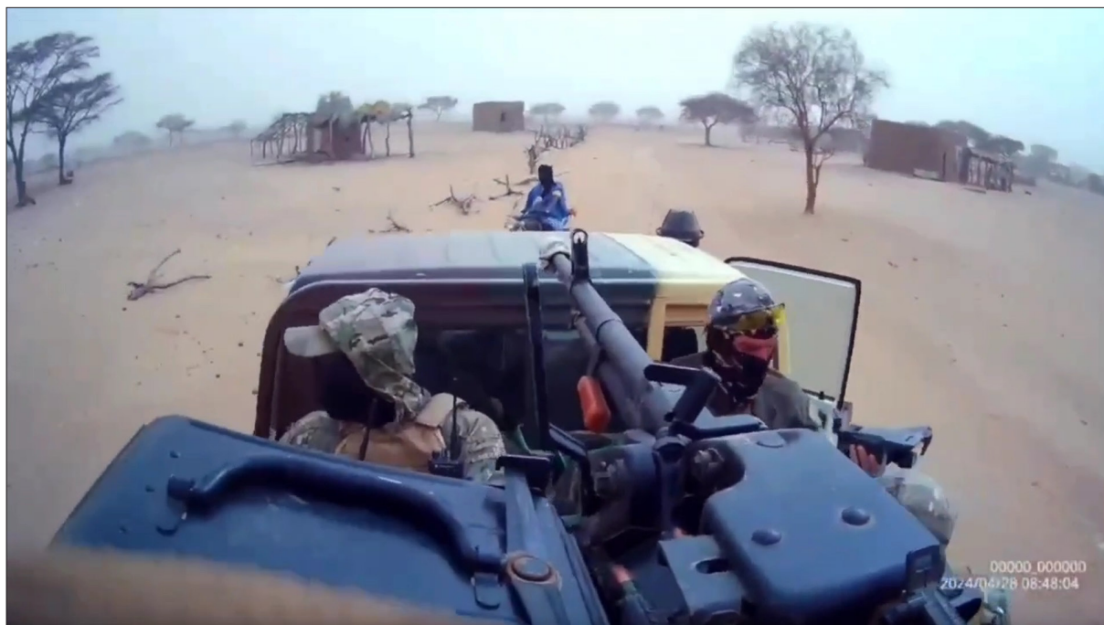
KA patrolujący okolicę granicy Mali i Mauretanii w kwietniu 2024 r.