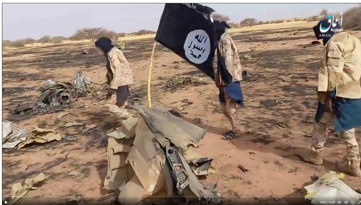
Bojownicy PI w pobliżu szczątków malijskiego myśliwca, rzekomo pilotowanego przez Rosjan, który rozbił się 29 kwietnia 2024 r.,